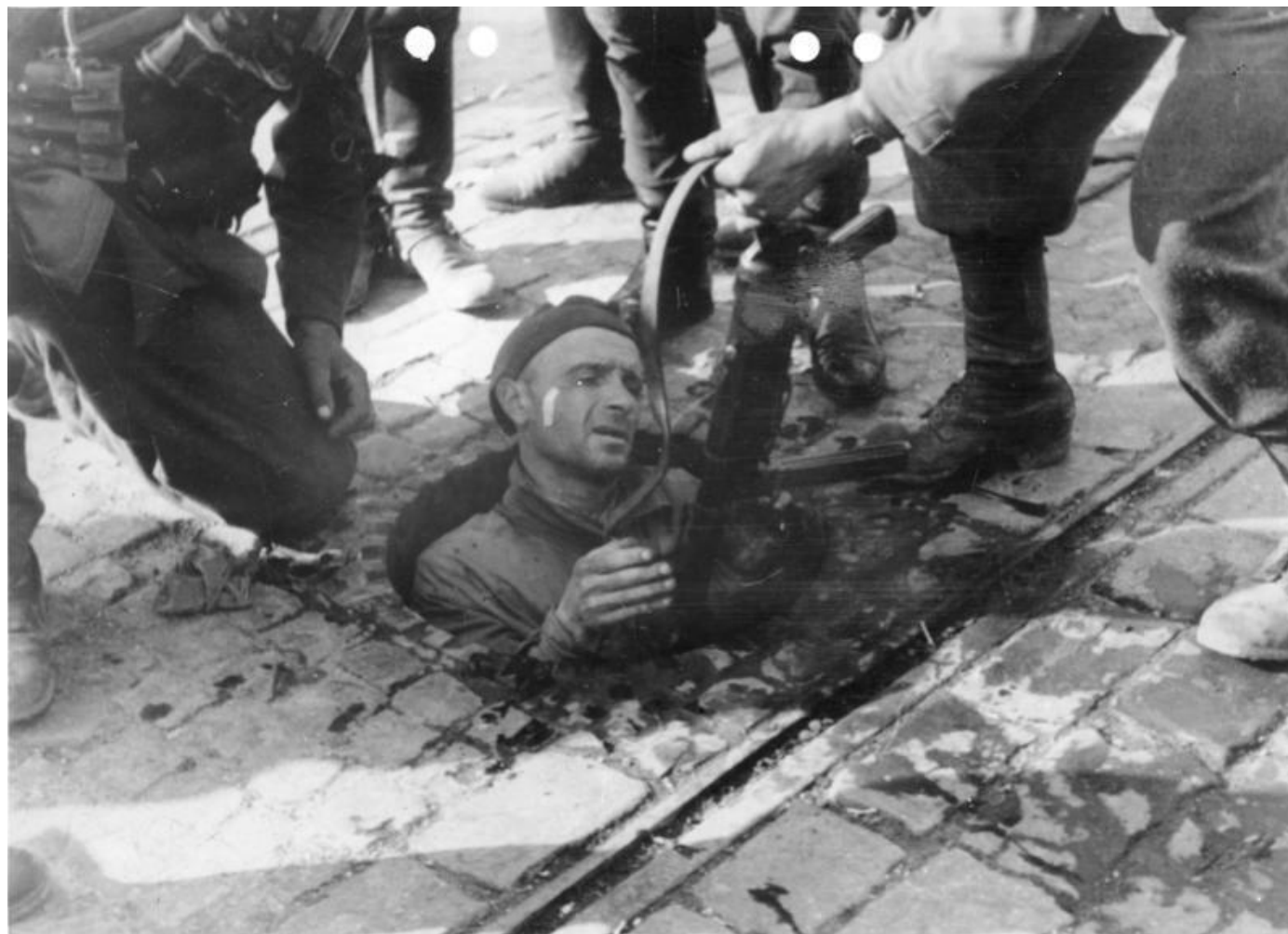
Powstaniec wyciągany z kanału przez żołnierzy niemieckich.

Ok. godziny 9:00 2 września gruzy zbombardowanego Sądu Apelacyjnego zawaliły główny wjazd na pl. Krasińskich.