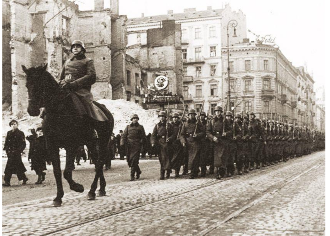
Wehrmacht wkracza do Warszawy 1 października 1939, źródło: wikicommons; unknown-anonymous - "Miasto Nieujarzmione" Warszawa 1957

- Nie tylko. Obowiązujące zasady powstawały za sprawą Niemców i nie-Niemców (...) Pewne rzeczy wolno było robić, inne nie. Jednych zakazywali Niemcy, a innych Polacy (...) Niemcy zakazywali chodzenia po ulicy wieczorami i manifestów patriotycznych. Polacy zakazywali chodzenia do kin, nawet jeśli wyświetlano w nich stare polskie produkcje. Zakazywali też przyjmowania żywności od Niemców rozdających ją w kilku miejscach Warszawy zaraz po kapitulacji, choć niektórzy ludzie dosłownie konali z głodu. Niemcy zakazywali nauki, posiadania radiodbiorników, broni, udzielania pomocy Żydom. Polacy (...) zakazywali polskim aktorom występowania w jawnych teatrach...”