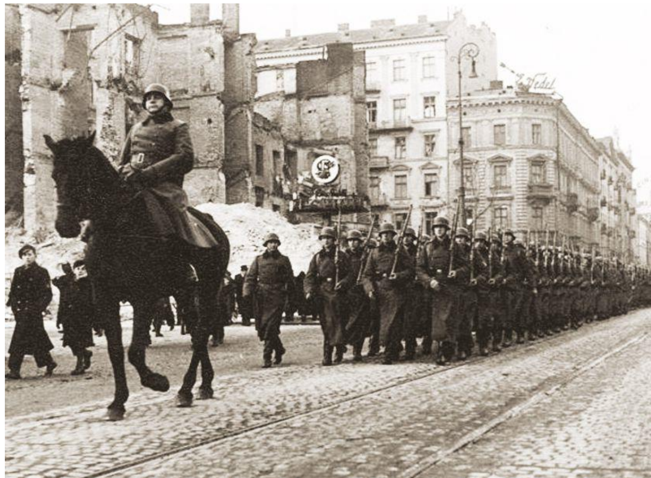
Wehrmacht wkracza do Warszawy 1 października 1939, źródło: wikicommons; unknown-anonymous - "Miasto Nieujarzmione" Warszawa 1957

„droga oddziaływania na własne społeczeństwo. Była również i dziedzina druga: oddziaływanie na Niemców warszawskich, na 20 000 cywilnych Niemców stale przebywających w stolicy oraz setki tysięcy przewalających się przez stolicę niemieckich żołnierzy i urzędników. Chodziło o to, by Niemiec widział i czuł, że podbity kraj nie został pokonany, że go jako okupanta nienawidzi. Chodziło o to, by dręczyć i niepokoić nieprzyjaciela unaocznieniem mu, iż istnieją podziemne siły polskie, każdej chwili gotowe do wyjścia na świat i do odwetu...”