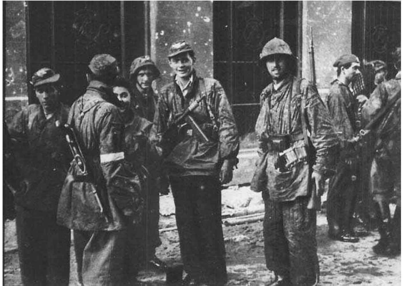
Żołnierze Batalionu „Zośka”. Okolice wjazdu kanałowego przy ul. Wareckiej źródło: Norman Davies: Powstanie '44. Kraków 2006